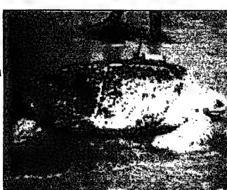
مخاطبة خضراء، تحمل جواز السفر الذي يحمل بالاعمار الصناعية

تحت إشراف القوات الجوية والبحرية، تقوم الإمارات العربية المتحدة بتطوير قدراتها في مجال المراقبة الفضائية. تستخدم الإمارات الأقمار الصناعية المتطورة لتتبع تحركات السفن البحرية، مما يساهم في تعزيز أمنها البحري. هذا التطور يأتي في إطار استراتيجية الإمارات الرامية إلى تعزيز قدراتها الدفاعية والتجسسية. كما تستخدم الأقمار الصناعية في مجالات أخرى، مثل الزراعة والبيئة.